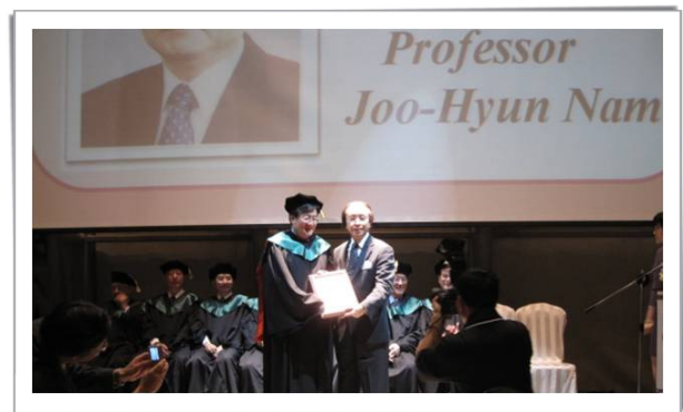
(대만산부인과학회 명예회원 추대식)